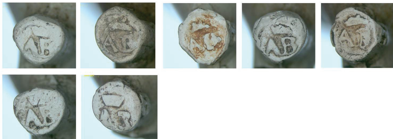
4c. Hielmerk AB gekroond.