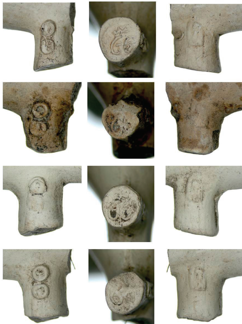
6b. Den Bosch, 66 gekroond.