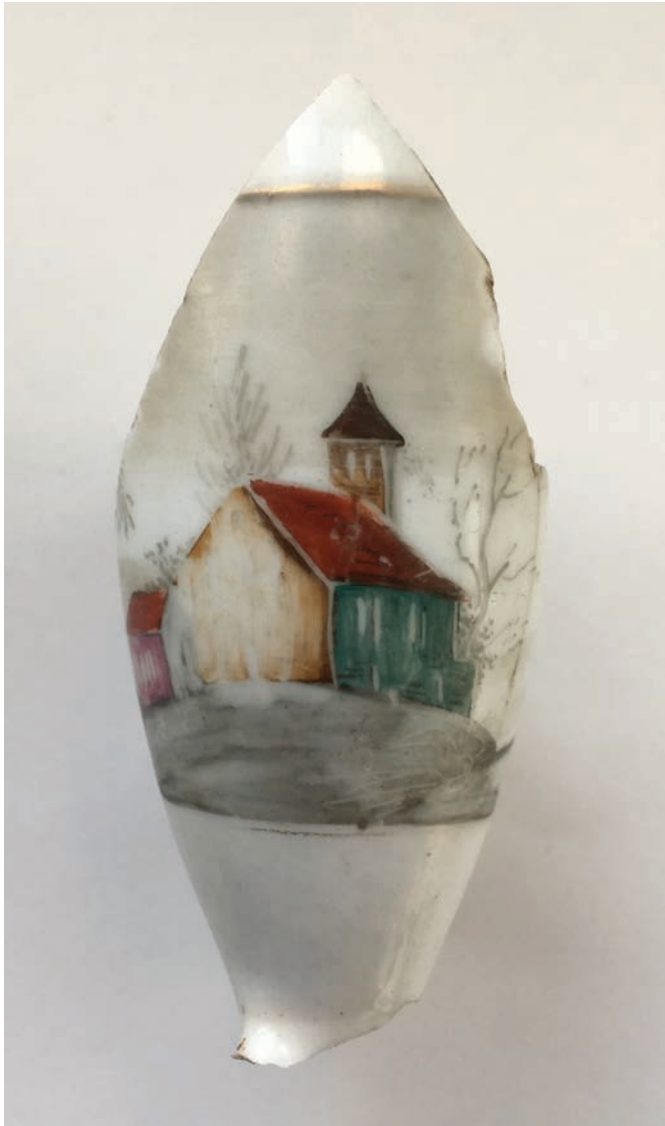
Afb. 7. Oostelbeers – Kamp bij Oirschot. Ketel van porseleinen Duitse pijp. Landschap met kerk (collectie Verspaandonk).

landschap met kerkje (afbeelding 7). Tijdens het veldwerk van de RCE zijn tien fragmenten van porseleinen pijpen gevonden: drie randfragmenten en zeven wandfragmenten. Het relatief grote aantal laat zien dat de drie in dit artikel beschreven collecties een forse negatieve selectie laten zien als het gaat om porseleinen pijpen.