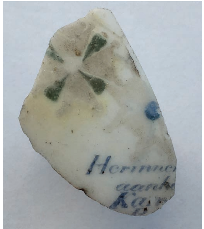
Afb. 9. Oostelbeers – Kamp bij Oirschot. Fragment van herinneringspijp (collectie Verspaandonk, OIO015 vnr. 44).

Herinner[...] aan he[...] Kam[...] b[...]