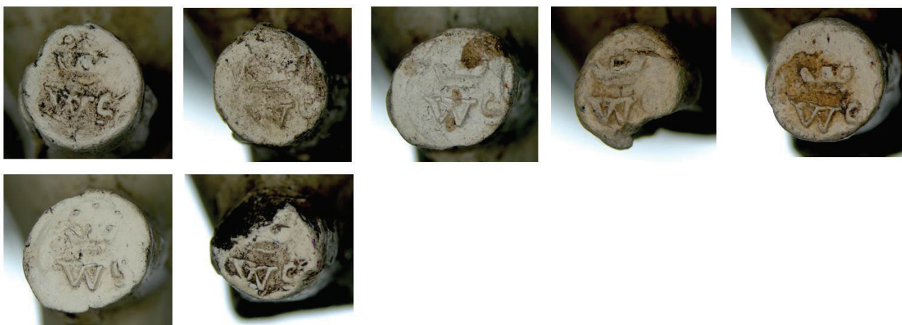
4h. Hielmerk WS gekroond.