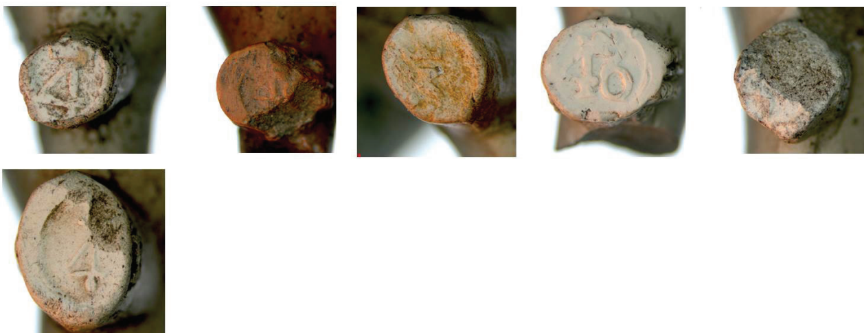
Afbeelding 5. Oostelbeers – Kamp bij Oirschot. Hielmerken Maaseik.