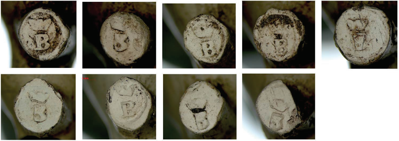
4e. Hielmerk B gekroond.