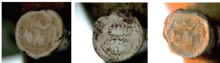
4h. Hielmerk Wijnton gekroond.