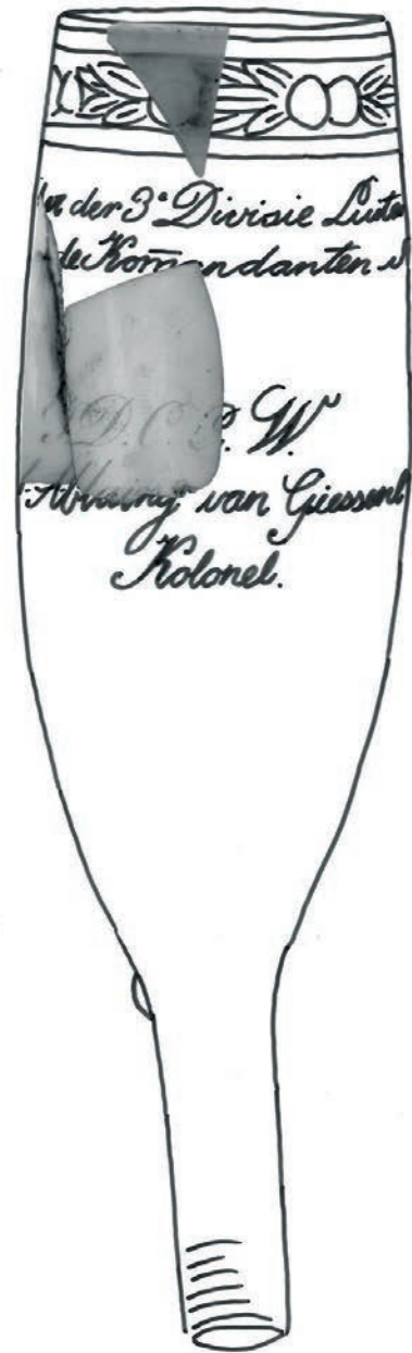
Afb. 8. Porseleinen pijp van kolonel d'Ablaing-Van Giessenburg (reconstructie en tekening Jan-Willem de Kort), OIOO15 vnrs 127 (vak 33) en 162 (vak 19).

Drie of mogelijk vier fragmenten uit de opgraving van de RCE behoren tot één bijzondere pijp. Ze worden hieronder in samenhang besproken met een losse vondst uit de collectie Verspaandonk 121 (afbeelding 9) en vier complete pijpen die zich in museale collecties bevinden en die in hun versiering en opschrift een directe relatie met het Kamp bij Oirschot laten zien. Het betreft hier vondsten die gedaan zijn bij een oppervlaktekartering ter hoogte van de lijn met kantines. Drie stukjes behoren tot één bijzondere beschilderde porseleinen pijp (zie afbeelding 8), waarvan de gekleurde gedeelten geheel verweerd zijn. De pijp is mogelijk een geschenk geweest van luitenant-generaal Meyer. Op basis van