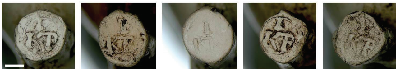
4g. Hielmerk KIP.