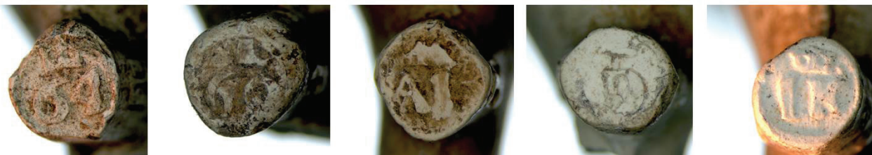
4a. Hielmerken 64 gekroond, 69 gekroond, AI gekroond, D en LK gekroond.