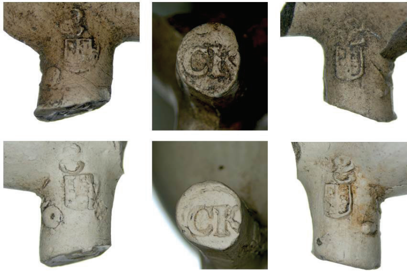
6a. Gouda, CK.