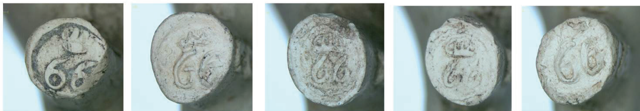
4b. Hielmerk 66 gekroond.