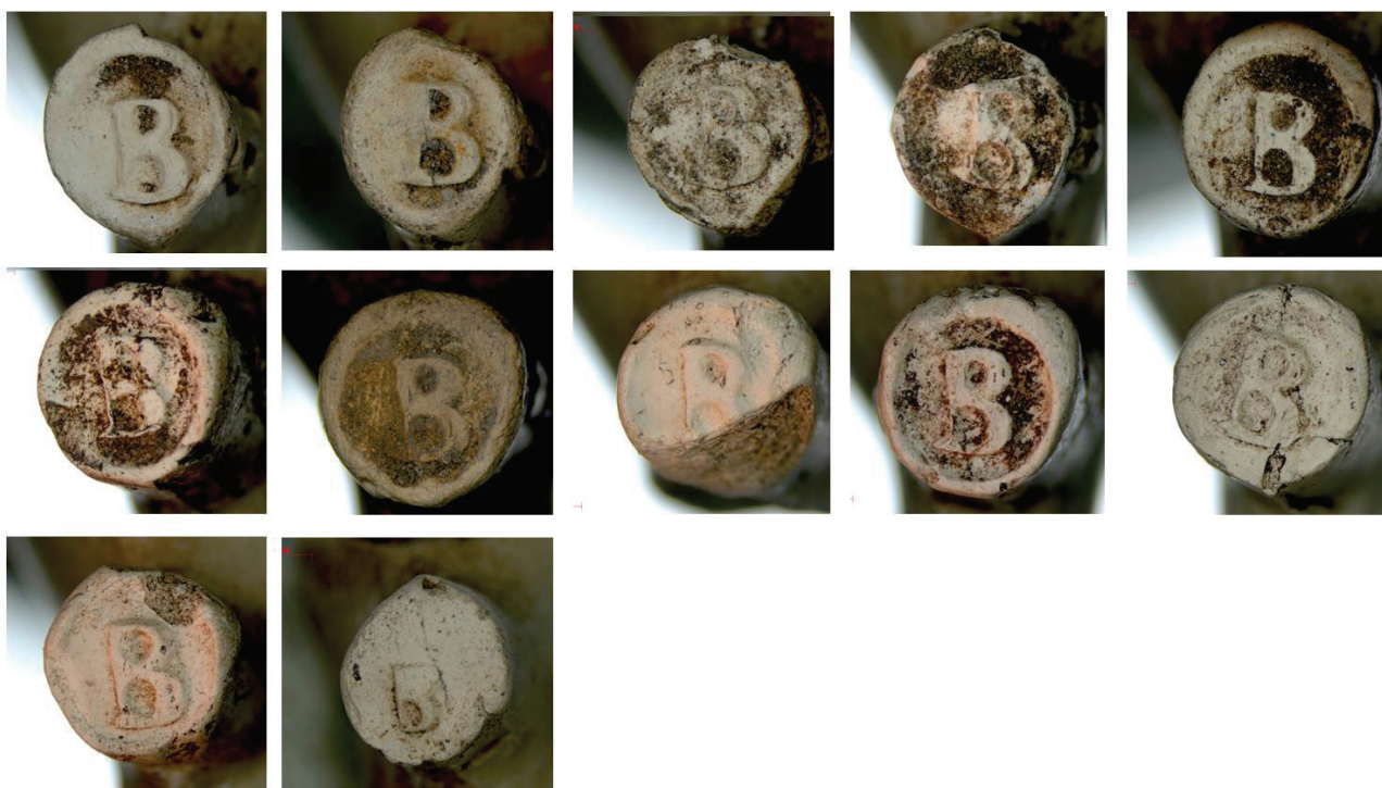
4d. Hielmerk B.