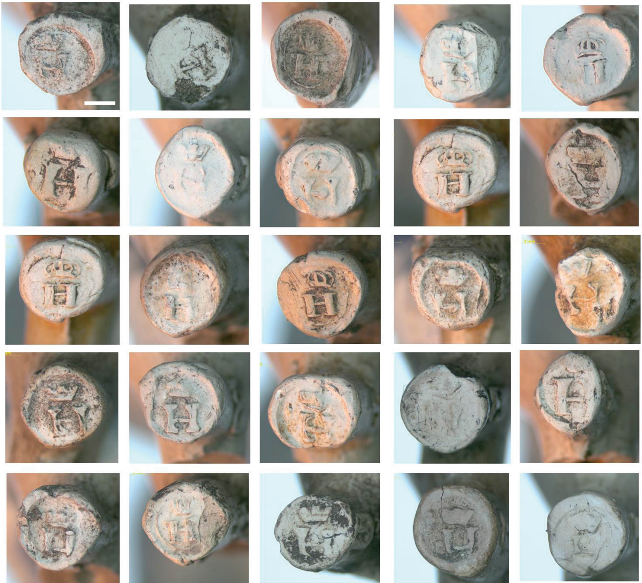
4f. Hielmerk H gekroond.