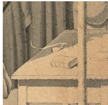
Afb. 1b. Detail van Afb. 1a. met tafel en Duitse pijp.